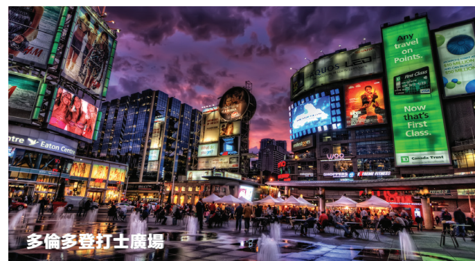
多倫多登打士廣場