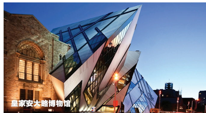
皇家安大略博物馆